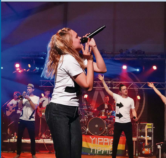
Die Muckesäck heizten am «Volksrock am Rebstock» ein.