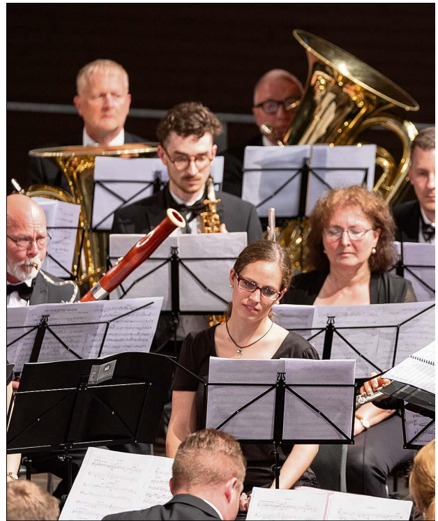
Die 75 Musikerinnen und Musiker des Blasorchesters Stadmusik Luzern spielten unter Leit