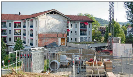
Beim Betagtenzentrum Linde wird schon fleissig gebaut. Die ehemalige Heimleiterwohnung ist bereits abgebrochen, und an ihrer Stelle werden nun die Erweiterungsbauten erstellt.