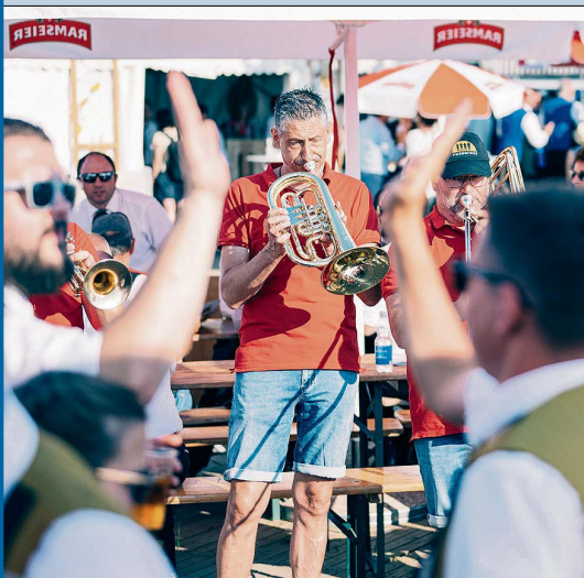
Feststimmung mit den Fassbrass auf dem grossen Festareal.