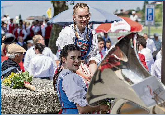
Junge Ehrendamen in Luzerner Tracht.