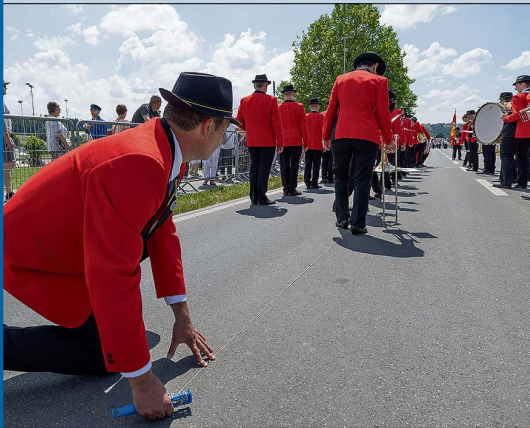
Letzter prüfender Blick bei der Feldmusik Grosswangen.